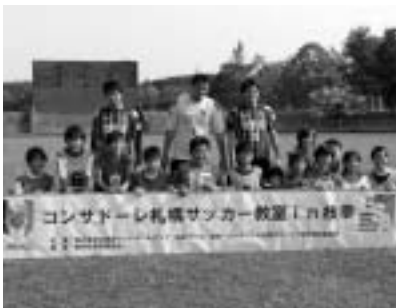
▶2年生初めての試合 ▶プロサッカー選手との交流

サッカーに興味のある方はもちろん、興味がなくてもみんなと一緒に体を動かしたいと思っているキッズ、小・中学生はいつでも入団できますので、どんどん参加してください。