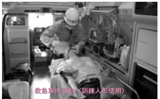
救急車内活動(訓練人形使用)

現在浜頓別消防支署には5名の救急救命士がありますが、気管挿管と薬剤投与のどちらも実施できる救命士は3名おり、今年度中に残り2名も薬剤投与講習を修了し、5名全員が薬剤投与を実施できるようになります。当支署の救急隊が心肺停止患者の救急活動にて、医師の指示下で救命処置を実施していることをご理解とご協力よろしくお願ひします。