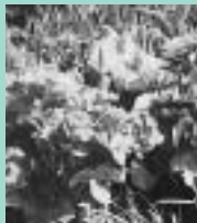
エゾノリュウキンカ