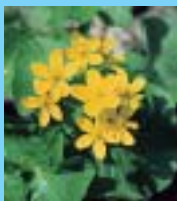
エゾノリュウキンカ