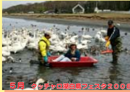
5月 クッチャロ湖白鳥フェスタ2008