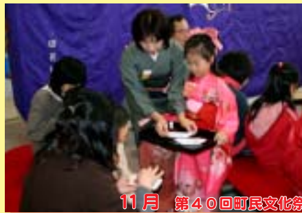
11月 第40回町民文化祭