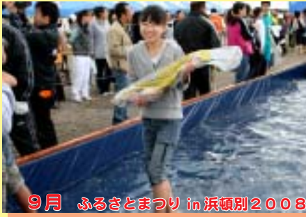
9月 ふるさとまつり in 浜頓別2008