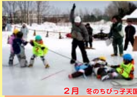
2月 冬のちびっ子天国