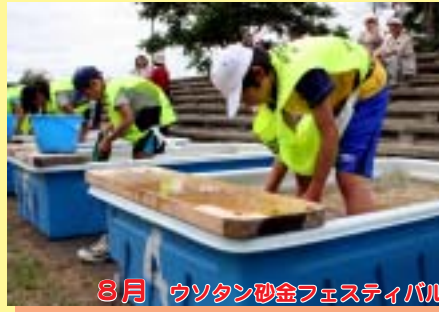
8月 ウソタン砂金フェスティバル