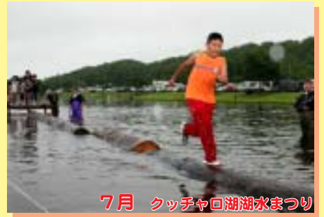
7月 クッチャロ湖湖水まつり