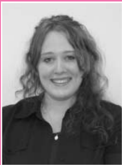
こんにちは！テリサです♪