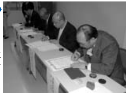
10月1日に行われたノーレジ袋・マイバック運動調印式の様子

これにより、10月1日より東宗谷農業協同組合、浜頓別町商工会加盟店でお買物の際、レジ袋を希望される方には1円以上の募金をお願いしています。