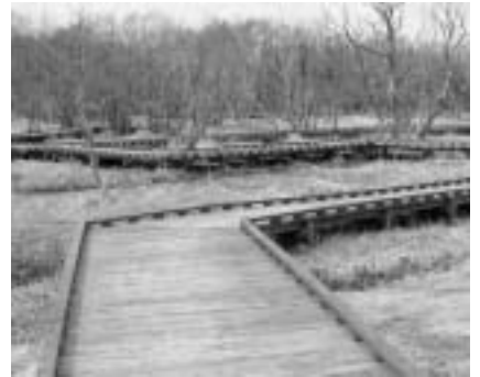
▲湿地帯などの木道から降りないでください。