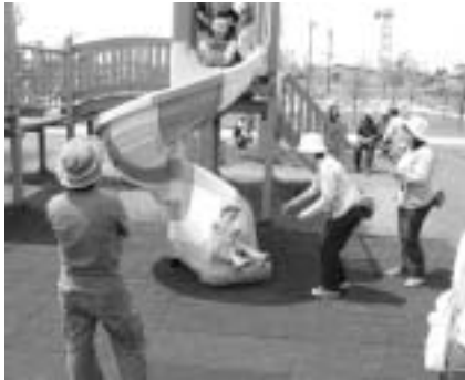
▲小さなお子さんが遊具で遊ぶ時は、保護者の方がしっかりと見守りましょう。

気温が低くまだ肌寒いので、「憩いのゾーン」の滝や池の水をまだ流しませんが、気温が上がり次第随時開放します。また、「緑のゾーン」につきましても、天気の良い日の散策にご利用ください。