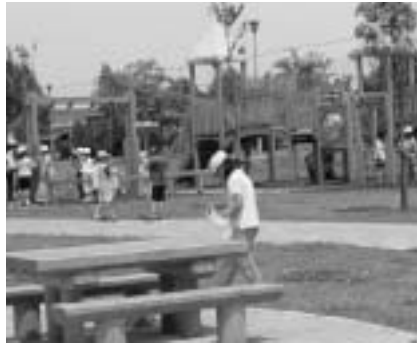
▲公園を快適に利用できるよう、ゴミなどは必ず持ち帰りましょう。