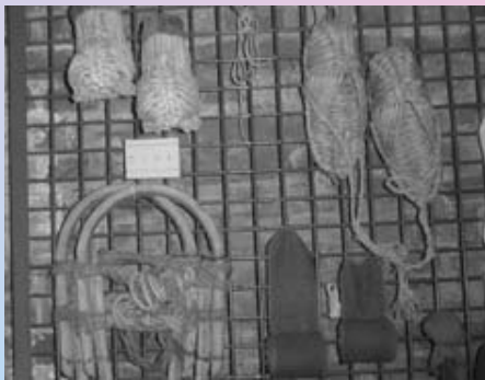
▲郷土資料館に展示しているカンジキ

単輪型は北陸地方から東北地方に分布し、複輪型は東北地方北部から北海道に、瓢箪型は岩手県北部とアイヌ民族にそれぞれ分布している。例えば、北陸地方から移住した人々も、移住後は単輪型でなく複輪型のカンジキを使用するのである。このように除雪具やカンジキからみても、北海道へ移住した人々は郷土の民俗をそのまま継承するだけでなく、北海道の自然環境に適応した生活方法を工夫したのである。