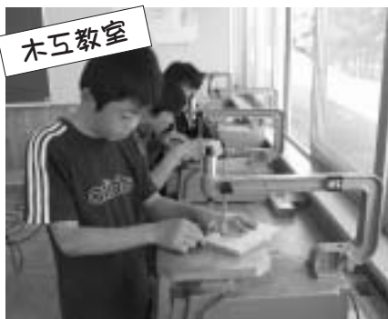
▲7月28日から29日までの日程で、やさしい木工教室が行われました。9名の参加者はカモのおもちゃを製作しました。