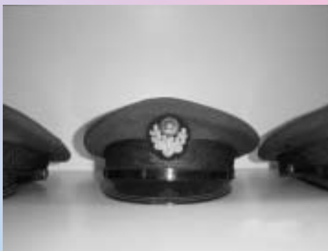
▲郷土資料館に展示している制帽

職帽は、運転規則上の駅長（副駅長や助役等を含む）がかぶる帽子です。運転士や技術関係者から見ると、責任者が一目でわかるようにするために職帽があるのです。 だから、職帽をかぶっていいのは、その駅長の担当駅の中のみです。また、他駅に応援に行ったときなどは、制帽をかぶります。