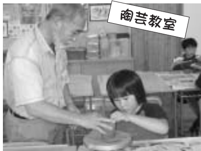
▲7月28日、陶芸教室が浜中美術室で行われました。8名の参加者は、思い思いの器を製作しました。