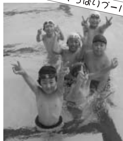
▲今年の夏は肌寒い天気が続きましたが、暖かくなると町民プールは子ども達で大賑わい。