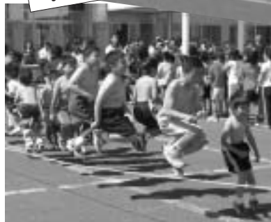
▲8月31日、第15回夏祭りふれあい広場が行われました。子ども達は長縄跳び大会などで汗を流しました。