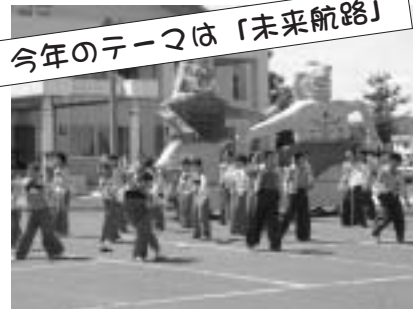
▲7月19日から21日までの日程で、第46回浜高祭が行われました。仮装パレードでは、趣向を凝らしたパフォーマンスを披露しました。