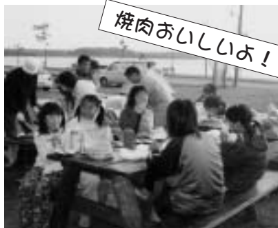
▲浜頓別アドベンチャークラブは、7月19日から1泊2日の日程でクッチャロ湖畔でキャンプを行いました。