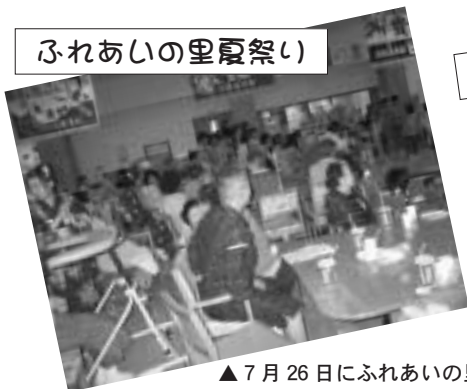
▲7月26日にふれあいの里で、8月6日には清風苑で夏祭りが行われました。お年寄りの皆さんは楽しいひとときを過ごしていました。