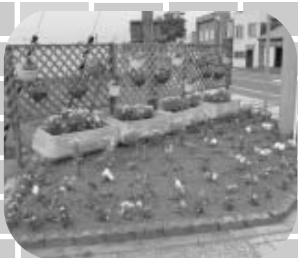
浜頓別 5 町内会