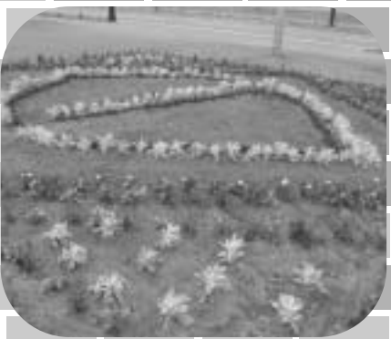
福寿大学と浜中生