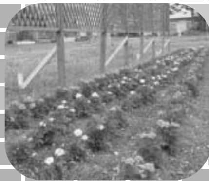
浜頓別 4 町内会