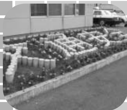
浜頓別 3 町内会