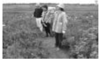
▲観光客にベニヤ原生花園の案内をするフラワーガイド

道北の短い夏に彩を添える草花が次々と咲く天然の花園「ベニヤ原生花園」では、町観光協会のフラワーガイドが、観光客に花の名前や生息する鳥などの説明をし、観光PRのために活躍しています。フラワーガイドは観光客だけではなく、町内の方にも花や鳥の説明をしてくれますので、ハマナスやノハナショウブなどの花を見に、みなさんもベニヤ原生花園に足を運んでみてはいかがでしょうか。