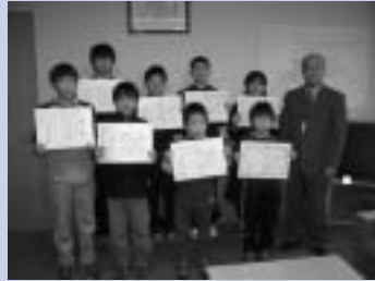
▲11月13日に行われた表彰式の様子

今年度は、町内の小学校から238作品、中学校から52作品の応募があり、その中から次の作品が選ばれました。