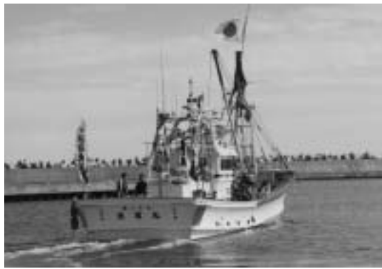
▲釣り船体験乗船には120人が参加