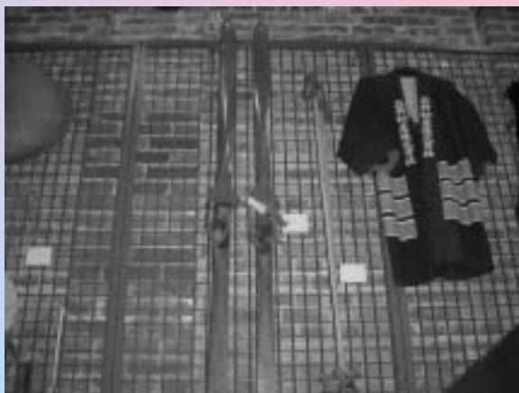
▲郷土資料館に展示している手作りスキー

自分でスキーを作る際、木 材はナラ等を使った。素人 には先を曲げるのが一番困 難だった。金具は簡単で、地 元の鍛冶屋等に作らせた。 また、コクワやブドウのつ るを使ってストックのリン グを作ったりもした。