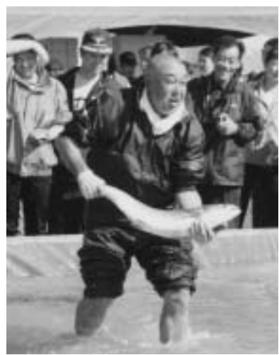
◀▲「絶対に放すものか〜！」暴れる秋あじを必死に捕む参加者