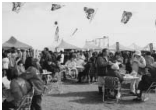
▲おいしい海の幸に舌鼓を打つ大勢の人々