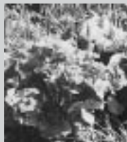
エゾリュウキンカ