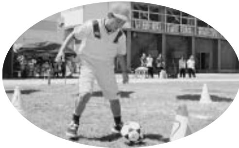
斜内小学校合同運動会