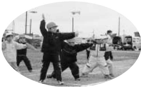
頓別小学校合同運動会