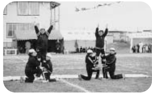
頓別小学校合同運動会