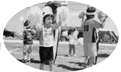
斜内小学校合同運動会