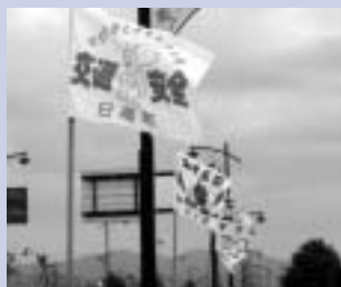
役場庁舎周辺からクッチャロ湖畔にかけて、北海道212市町村の交通安全旗がなびいています。

○六才未満の幼児を乗車させるときは、必ずチャイルドシートを使用し、子どもの体格にあったものをゆるみなどが生じないように車に正しく装着しましょう。