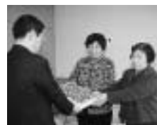
▲商工会婦人部より