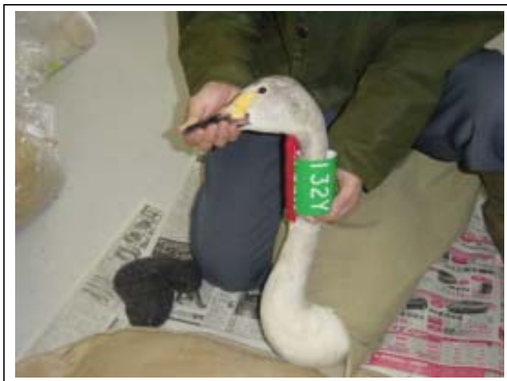
クチバシの模様を記録し放鳥しました。