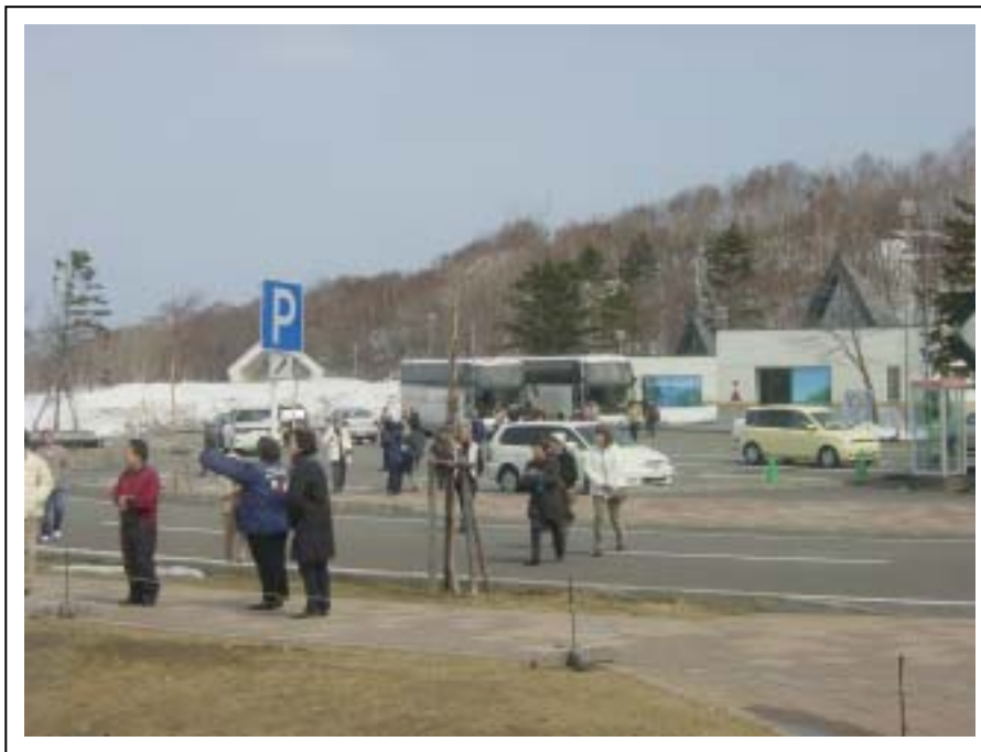
観光バスの入込みで賑わう湖畔の

今春のコハクチョウの飛来数は、例年に比べ更に少ないものとなりました。例年に比べて雪解けが遅い事が影響したのか、各地の越冬地からも飛び立ちの遅い白鳥たちが残っているとの情報が入ってきていました。