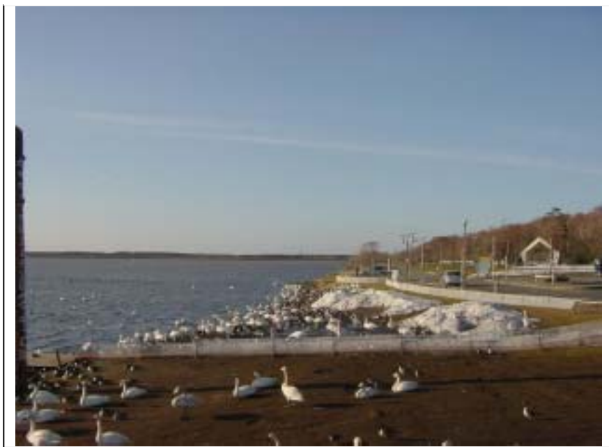
岸にあがって、くつろぐコハクチョウたち

白鳥などの渡り鳥は、季節の変化を読み取りながら、渡りの時期を決めているとされており、特に日照時間などの年による変化の少ないものが旅立ちの時期を決めるのに大きな影響を与えていると考えられています。このため、野鳥の渡りの時期は極端にずれる事はあまりありません。しかし、今シーズンのように雪解けが例年よりも遅くなるとその判断を鈍らせてしまうのか、野鳥の渡りに影響を与えてしまうようです。